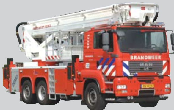
Bronto Skylift F32 RLX